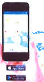
App som säger till när tunnan behöver tömmas