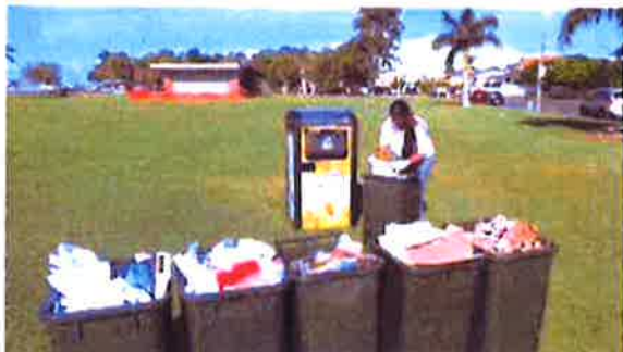
I en enda smart tunna med en komprimator får det plats sex gånger så mycket sopor.