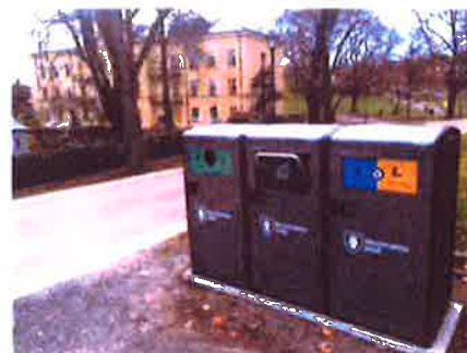
Ställ flera i grupp och skapa en återvinnings station

Jag var på en mäsä där jag såg en riktigt intressant produkt, BigBelly Solar. En tät, solcellsdriven, komprimerande smart tunna, som man även kan använda som fri surfzoon på strategiska platser, tex Hökartorget där man skulle kunna äta sin lunch och samtidigt vara uppkopplad mot WiFi. Det skulle kunna göra platser som hökartorget till ännu attraktivare samlingsplatser