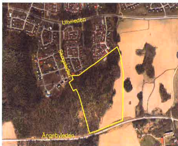
Karta över området

värdet ligger i den byggrätt som tomten har. Viss prisjustering kan också vara motiverad för tomter med sämre förutsättningar på grund av t.ex. besvärliga markförhållanden eller läge precis vid infart till området. Tomterna med nummer 35–42 i bilagd tomtkarta är aktuella att bebygga med radhus för att få en blandning av hustyper i området. I så fall kommer fastighetsindelningen och även prissättningen se annorlunda ut. Stadsarkitektkontoret föreslår dock att även dessa tomter prissätts för det fall tänkt radhusprojekt inte fullföljs och de istället säljs som styckebyggartomter.