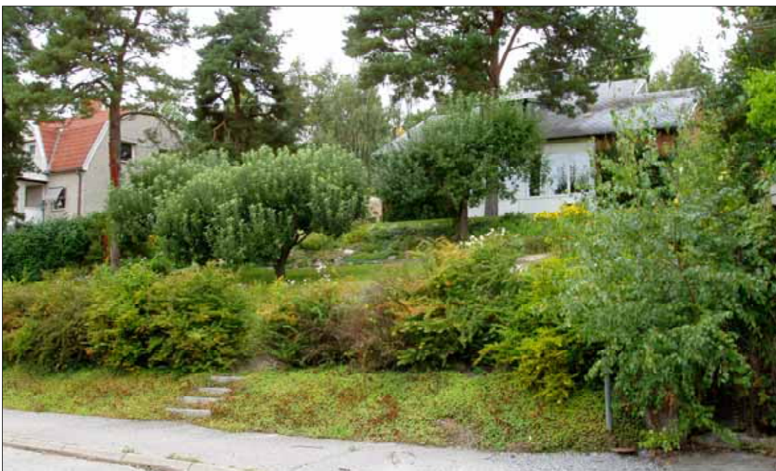
Brynjan 6 från Nyckelbergsvägen

Brynjan 6 är bebyggd med ett 1½-plans bostadshus med källare och sammanbyggd garagedel samt en takad uteplats i gräns mot Brynjan 5. Fastigheten omfattar 1203 kvm tomtarea.