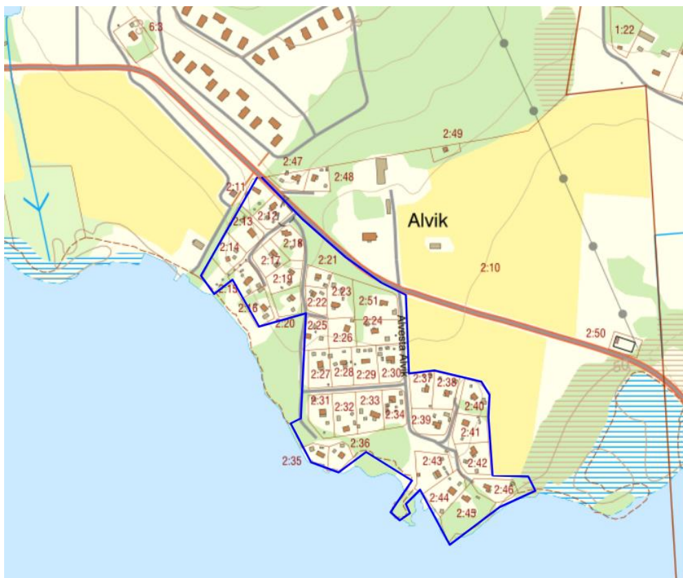
Ungefärligt planområde för detaljplan PL 158 markerat i blått.