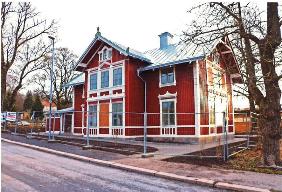
Bååthska villan, renoverad under 2017