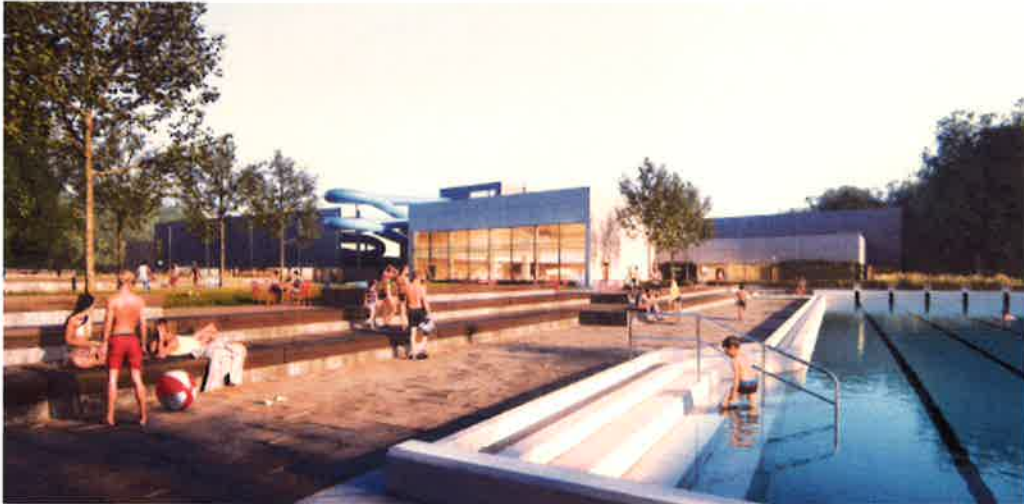
Planerad vy från utomhusbadet med befintlig utomhusbassäng till höger.