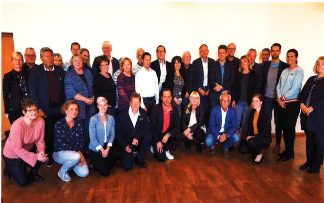
Den 15 september träffades chefer från nästan alla verksamheter inom KAK-kommunerna för att presentera konkreta förslag kring möjliga samverkansområden.

Köpings, Arboga och Kungsörs kommuner har arbetat nära Kommunutredningen och har under hösten ingått i Kommunutredningens och SKL:s fallstudie.