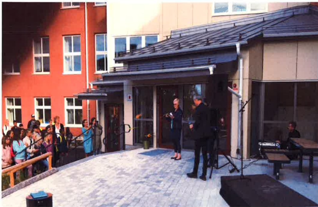
Invigning den 22 augusti 2017.

Efter renovering av huvudbyggnaden påbörjades arbetet med annexbyggnaden, etapp 2. Renovering och ombyggnation av annexbyggnaden har pågått under hela 2016 och slutfördes under sommaren 2017. Byggnaden återinvigdes i samband med höstterminstarten den 22 augusti.