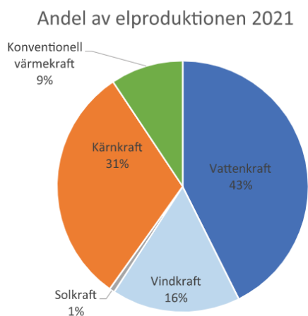
Figur 1 elproduktion i Sverige 2021.

Under 2021 producerades 166 TWh el i Sverige varav 140 TWh användes i Sverige och 16TWh exporterades. Av den el som producerades kom 27,4 TWh eller 16% från vindkraft 2 .